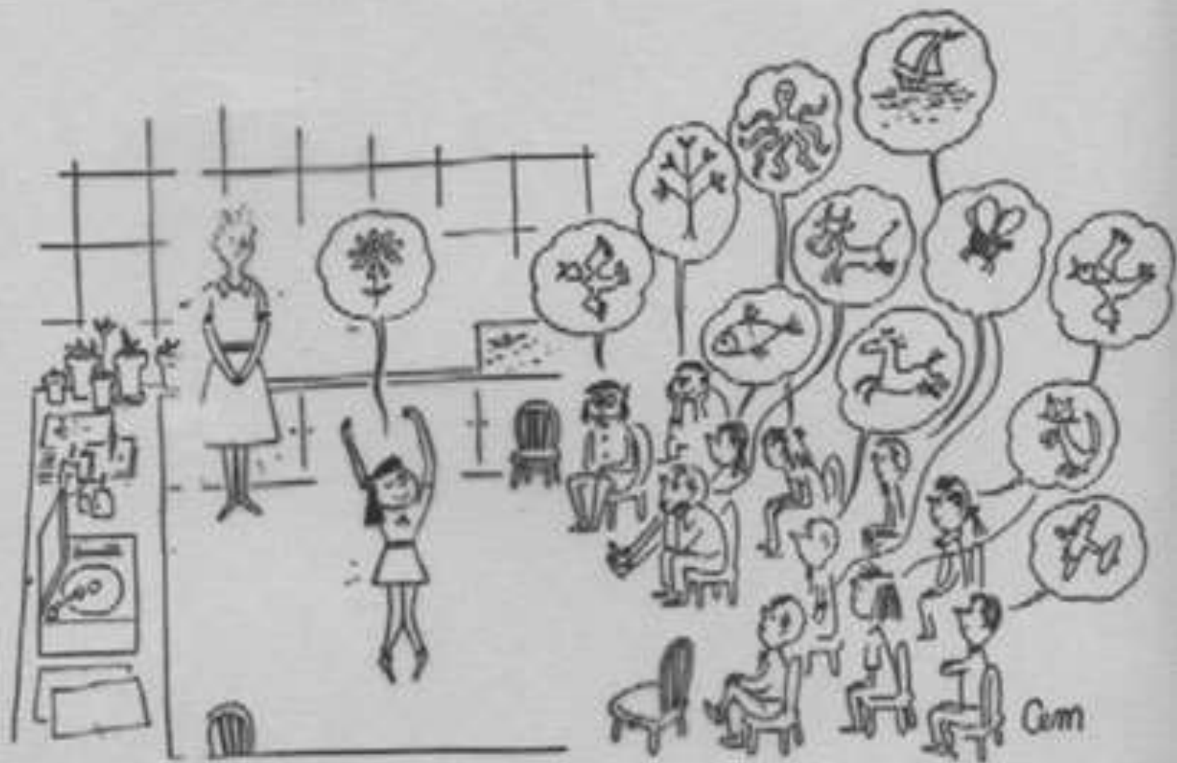
Fig. 139. Presentación escéptica de la comunicación no verbal, obra de CEM. De The New Yorker .